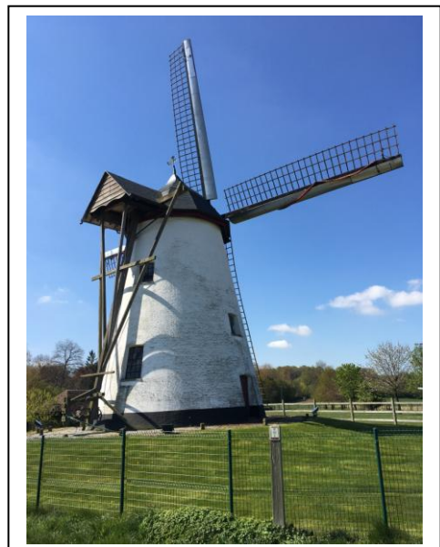
Molen ter Hengst.

Deze typische zuid-Vlaamse molen met zetelkap werd gebouwd in 1834. Vroeger stond er een staakmolen. Op deze eeuwenoude plek stond al een molen in 1275.