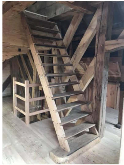
De molen zal in juni volledig afgewerkt zijn.

De molen werd in 2019 heropgebouwd door de firma Boers & Peusens uit Merelbelke.