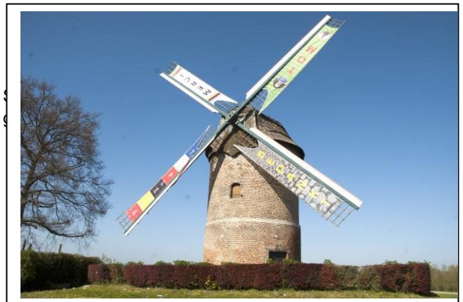
(c) Eddy De Saedeleer - Moulin Vertain Templeuve

In Vlaams-Brabant is enkel in Betekom een restant van een dergelijke molen overgebleven.