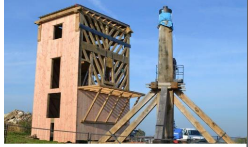
(c) Berre Demol - Molen te Thimougies.